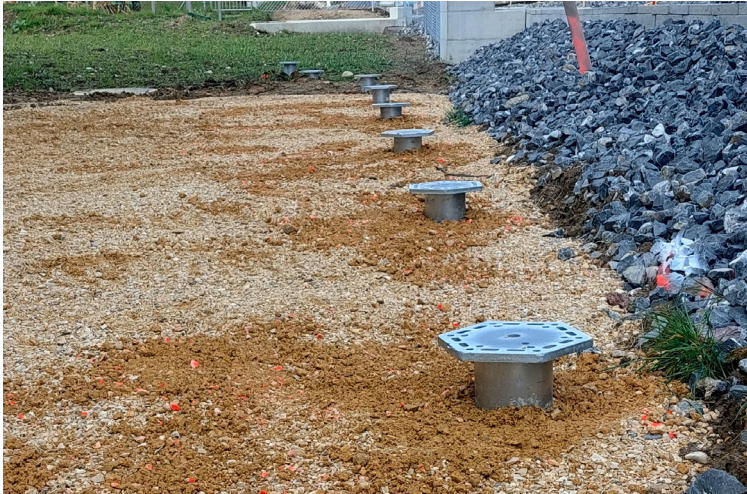
Die Schraubfundamente wurden schnell und unkompliziert eingedreht