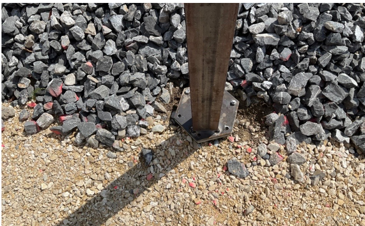
Die Stützen der Sichtschutzwand werden auf dem Flansch der M-Serie montiert