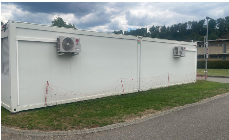
Auf der „Grünen Wiese“: Fundamentbau in 2 Tagen