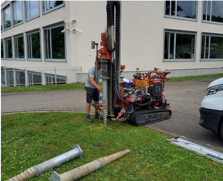
Direkteinbau ohne Abhumusierung (Occasionsfundamente)