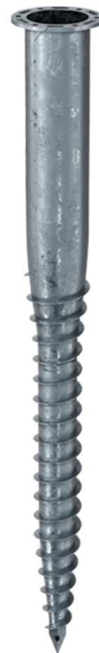
KSF F 140x1300-P

Sous réserve de modifications techniques! Produit destiné à un usage professionnel selon les instructions.