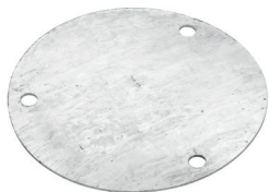
Couverture 2 mm-P Art.-Nr. 20070