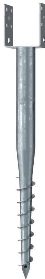
KSF U 60x730-111

Technische Änderungen vorbehalten! Produkt für den beruflichen Gebrauch nach Instruktion.