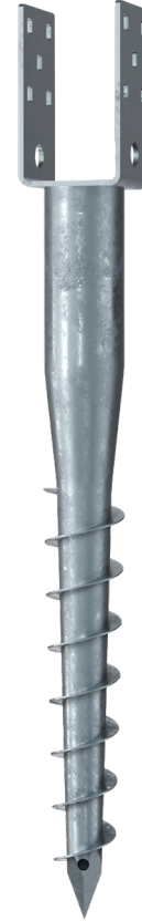
KSF U 60x730-71