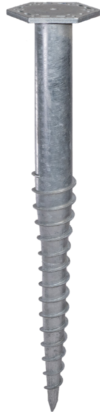
KSF M 76x1300-M24 (SW245/F15)

Eindrehadapter: Z1 Aufsatz-F1234567 Art.-Nr. 21841