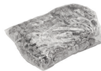
Spezialgranulat 1,50 kg Art.-Nr. 21824