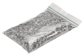
Spezialgranulat 0,50 kg Art.-Nr. 21823