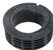
Exzenter-E60 Art.-Nr. 24801