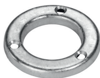
Klemmring-E60 Art.-Nr. 24802