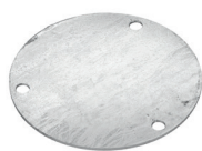
Abdeckung 2 mm-E60 Art.-Nr. 24808