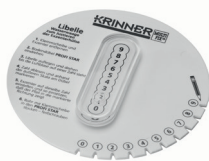
Libelle-E60 Art.-Nr. 24803