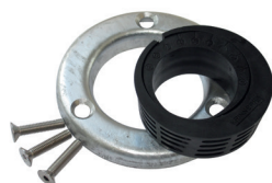
Exzentrersatz-E60 Art.-Nr. 24817