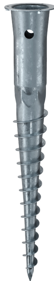
KSF E 89x800-E60

Technische Änderungen vorbehalten! Produkt für den beruflichen Gebrauch nach Instruktion.