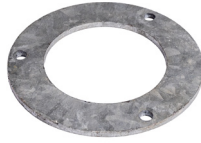
Klemmring für KSF E 140 Klemmring für Schraubfundamente der E-Serie (E76-100)